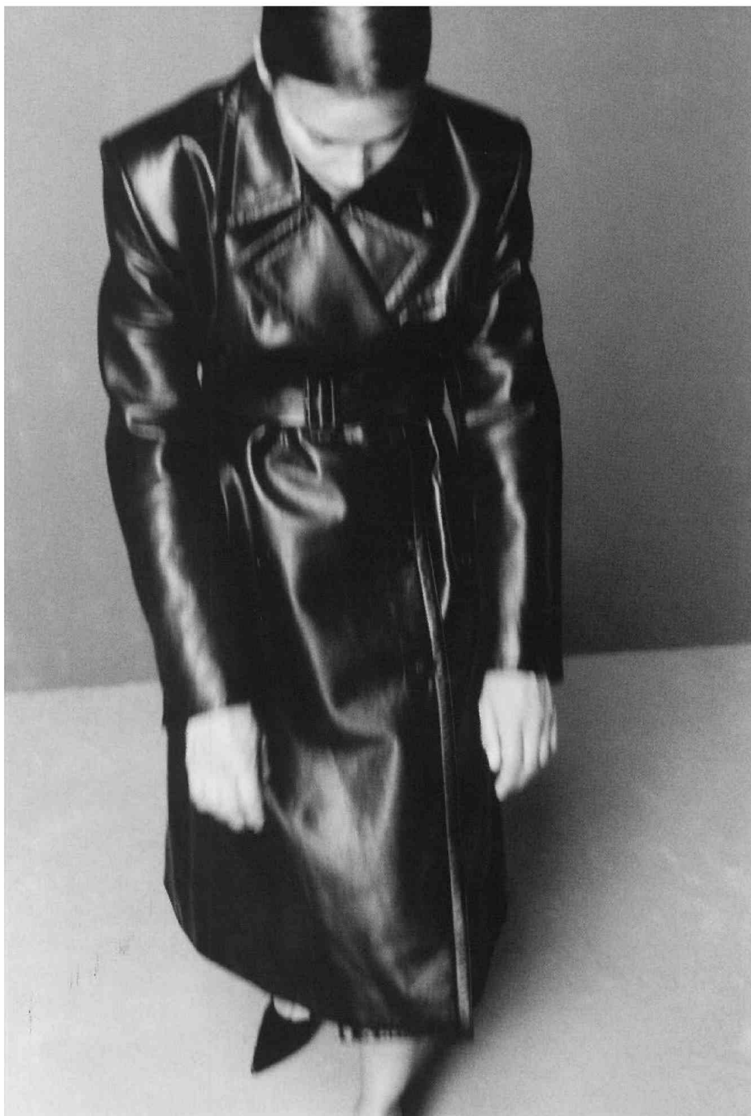
FRANCIA - SELF SERVICE - FW22