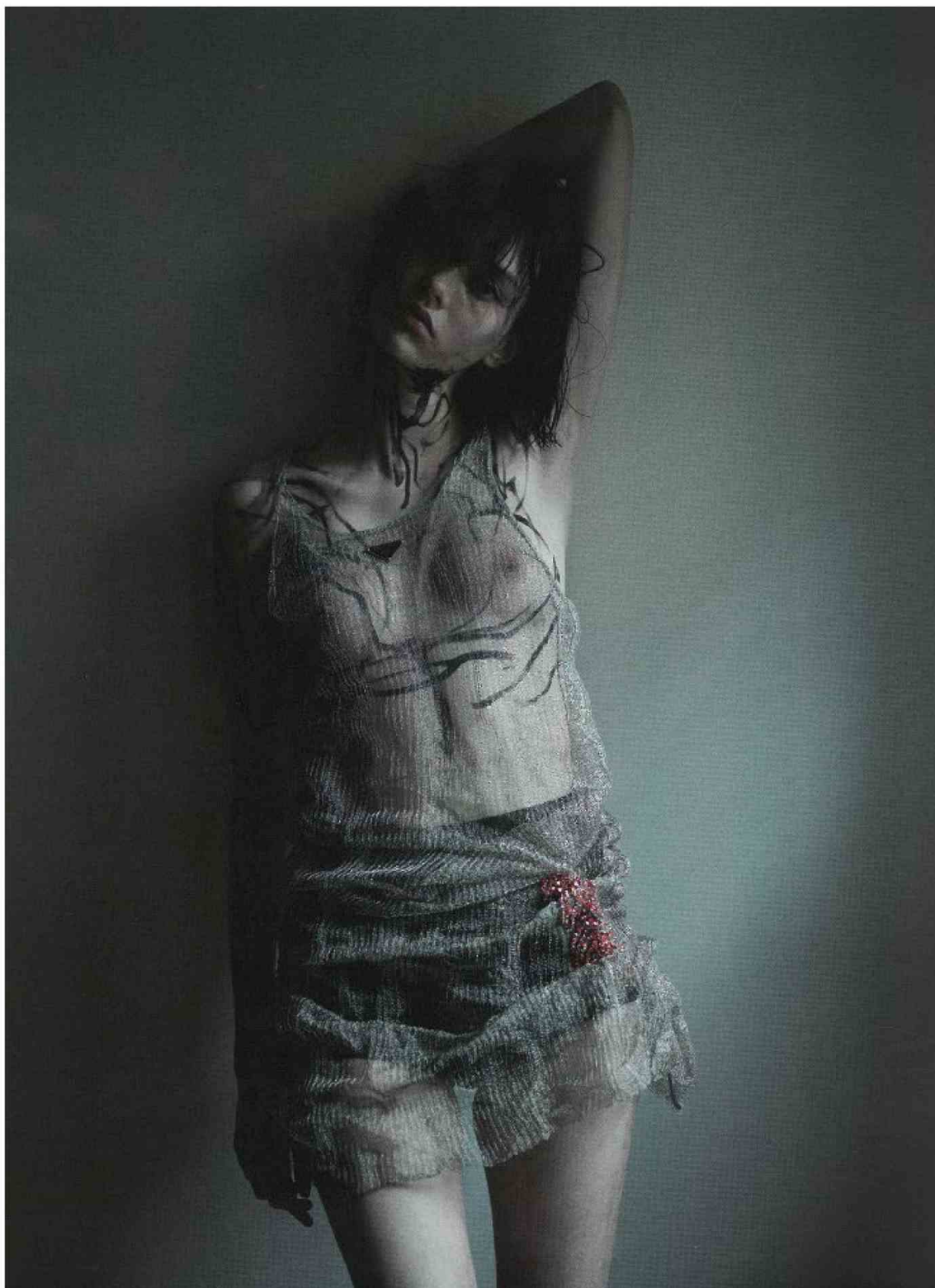
FRANCIA - SELF SERVICE - FW22