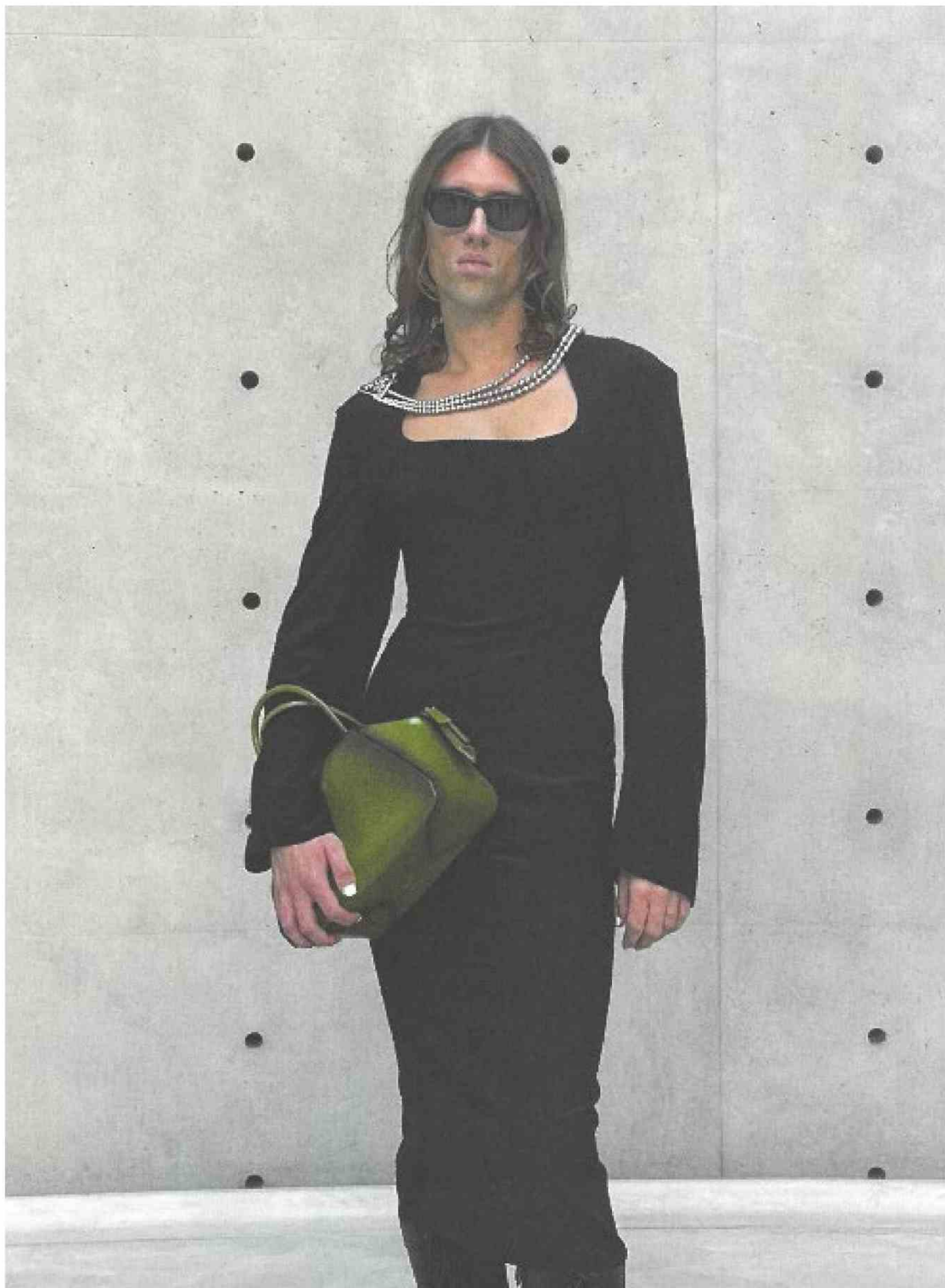
FRANCIA - SELF SERVICE - FW22