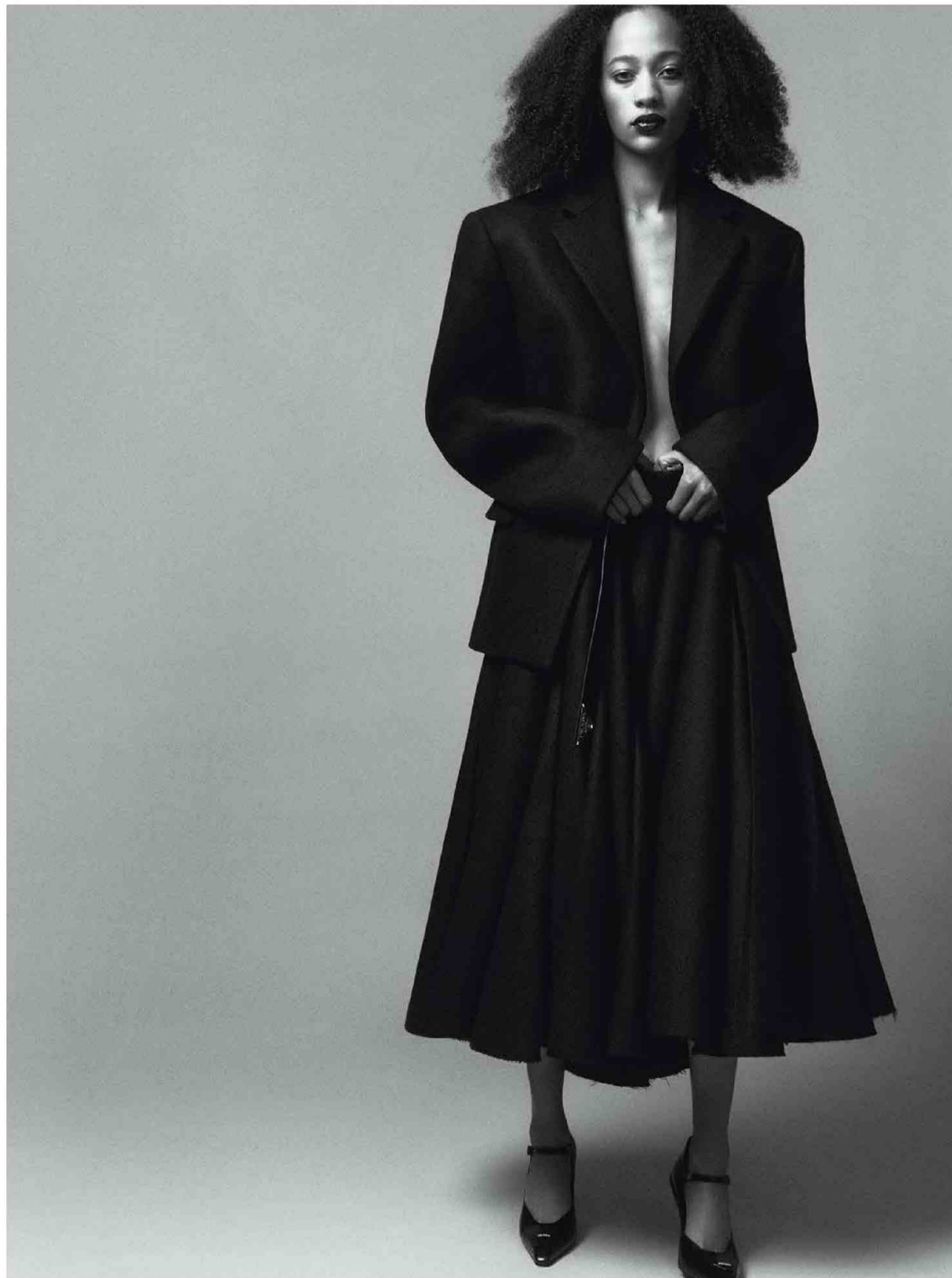
FRANCIA - SELF SERVICE - FW22