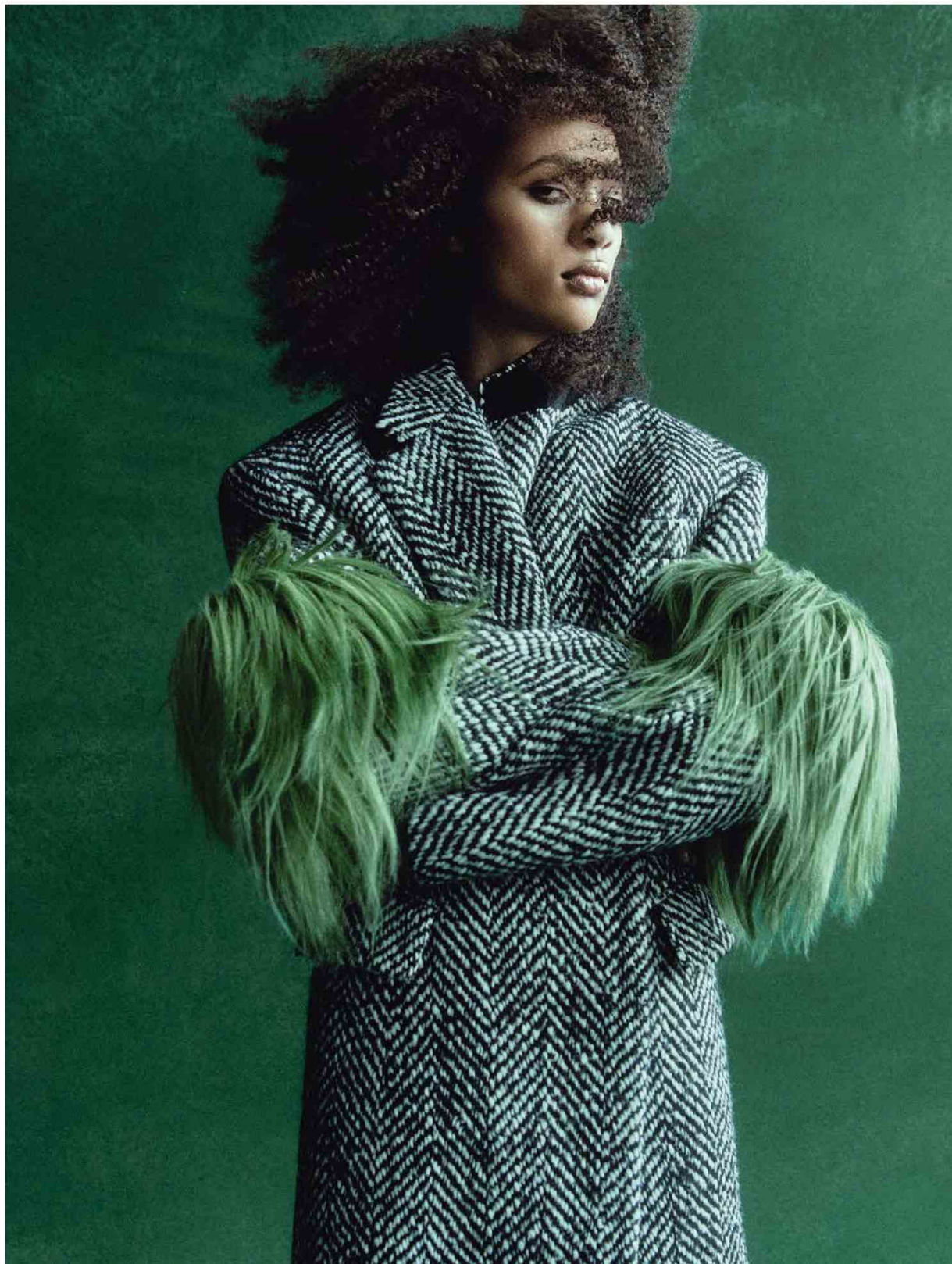
FRANCIA – SELF SERVICE – FW22