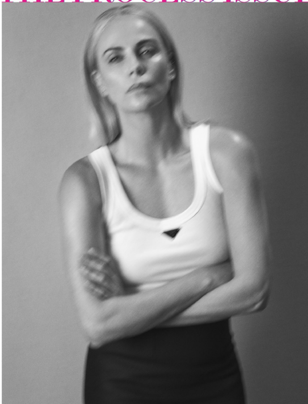
Styling by STELLA GREENSPAN Tank top and skirt, PRADA. Earrings, Theron's own.

HAIR: ORLANDO PITA FOR ORLANDO PITA PLAY, MAKEUP: SALLY BRANKA FOR DIOR; MANICURE: TOM BACHIK FOR DIOR VERNIS