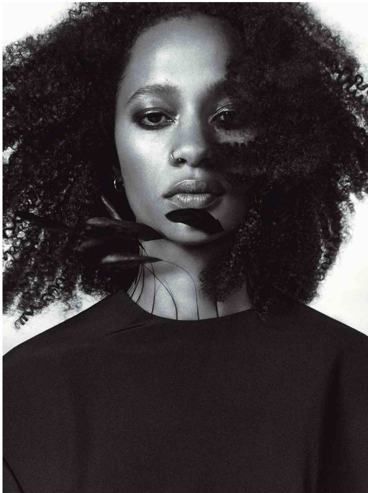
FRANCIA - SELF SERVICE - FW22