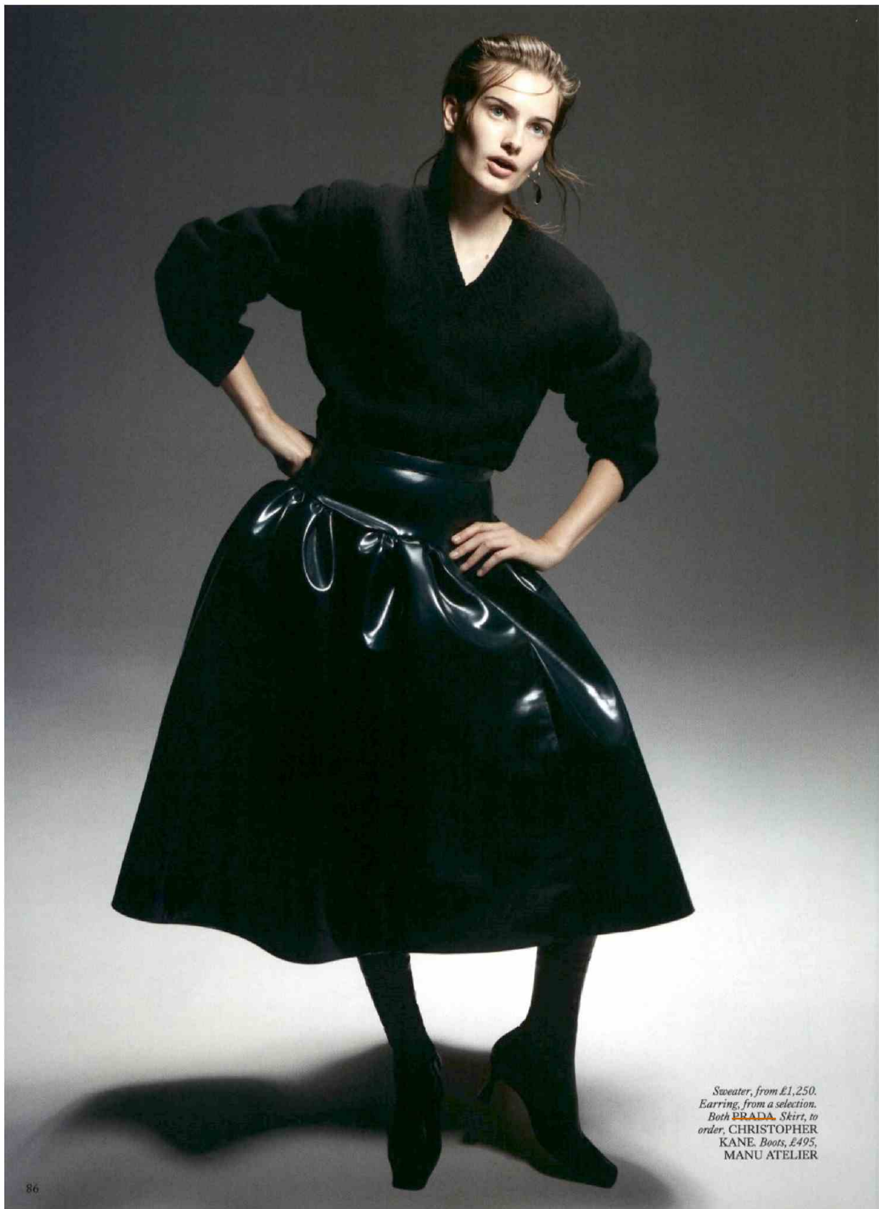
Sweater, from £1,250. Earring, from a selection. Both PRADA. Skirt, to order, CHRISTOPHER KANE. Boots, £495, MANU ATELIER