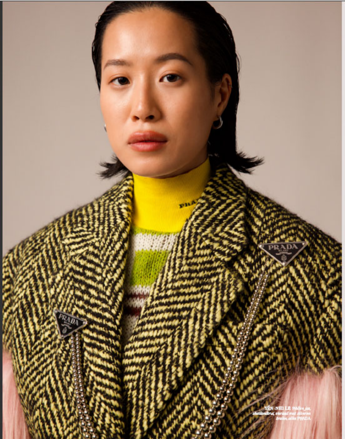
OLANDA - VOGUE - PRADA - 10.11.20