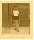
Prada jacket and skirt.