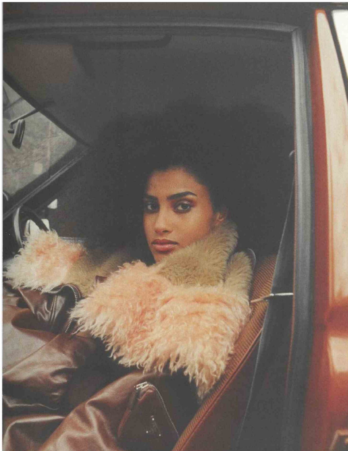
FRANCIA - SELF SERVICE - FW22