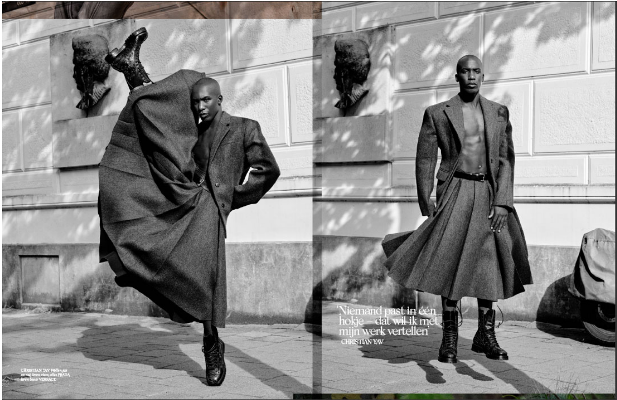
OLANDA - VOGUE - PRADA - 10.11.20