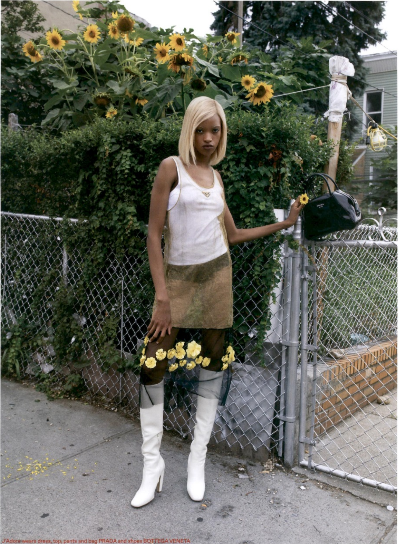
J'Adore wears dress, top, pants and bag PRADA and shoes BOTTEGA VENETA