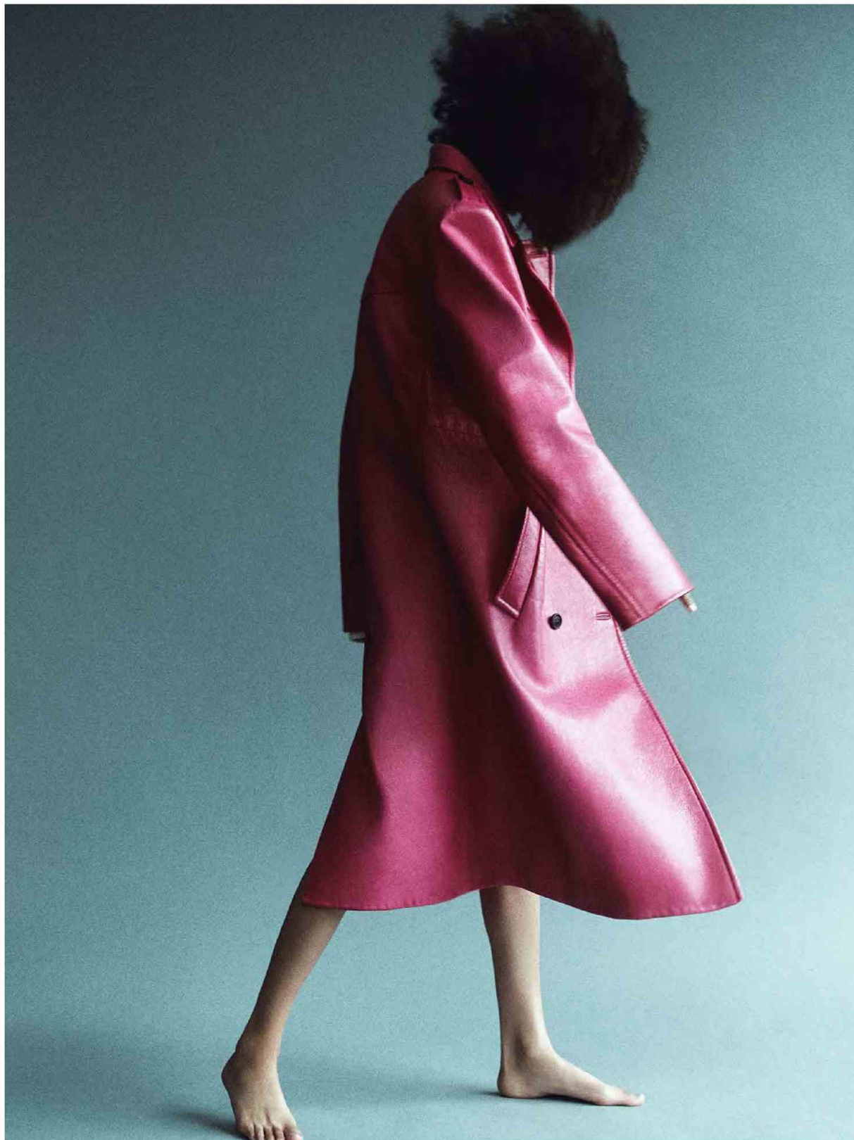
FRANCIA - SELF SERVICE - FW22