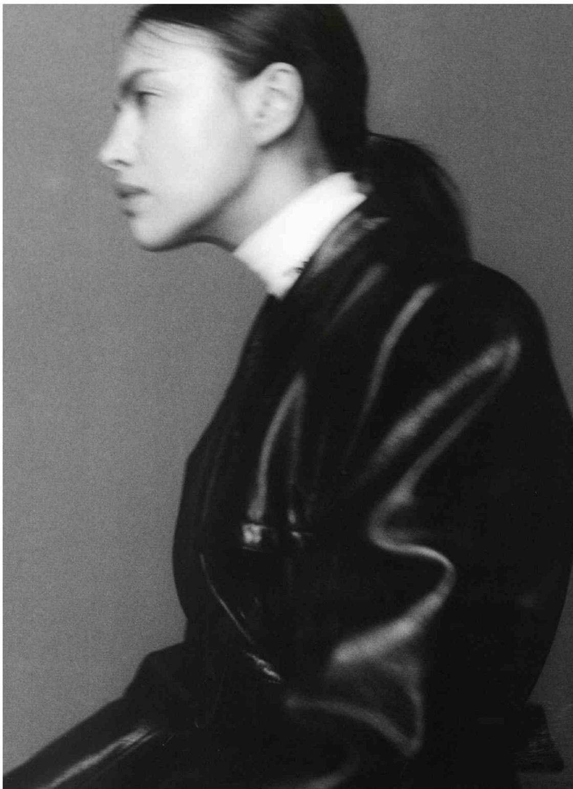
FRANCIA - SELF SERVICE - FW22